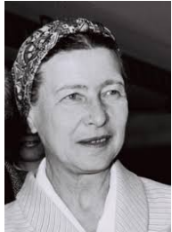
Simone de Beauvoir

Olympe de Gouges : Née à Montauban le 7 mai 1748, Olympe de Gouges est une femme politique considérée comme l'une des pionnières du féminisme français. Révolutionnaire féministe, elle a laissé de nombreux écrits en faveur des droits civils et politiques des femmes et de l'abolition de l'esclavage des Noirs. Réelle figure de la lutte pour la femme, elle fut l'un des premiers symboles féministes français.